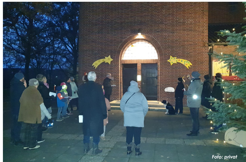
Am Weihnachtsbaum an der Kirche St. Gottfried.