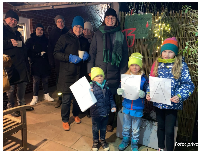
Die wohl größte Zahl hatte in diesem Jahr der Posaunenchor Mecklenbeck erstellt. Adventsquiz für alle Altersgruppen (Bild oben)